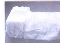
◇ご遺体用安置布団