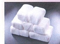
◇ドライアイス1日分